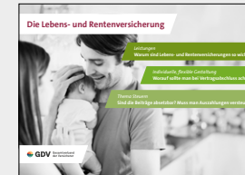
Die Lebens- und Rentenversicherung