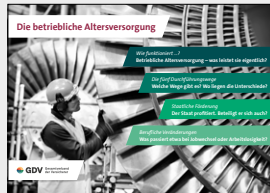
Die betriebliche Altersversorgung