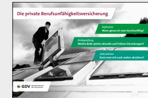
Die private Berufsunfähigkeitsversicherung