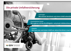
Die private Unfallversicherung