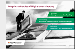
Die private Berufsunfähigkeitsversicherung