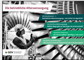
Die betriebliche Altersversorgung