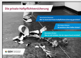
Die private Haftpflichtversicherung