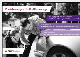
Versicherungen für Kraftfahrzeuge