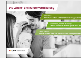
Die Lebens- und Rentenversicherung