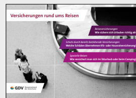
Versicherungen rund ums Reisen