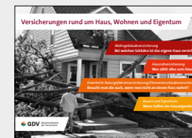
Versicherungen rund um Haus, Wohnen und Eigentum