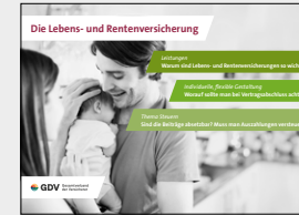
Die Lebens- und Rentenversicherung