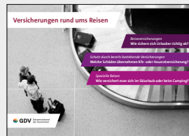
Versicherungen rund ums Reisen