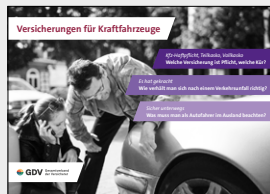
Versicherungen für Kraftfahrzeuge