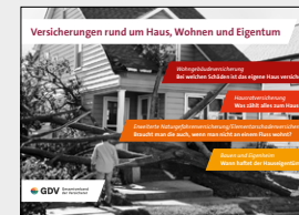
Versicherungen rund um Haus, Wohnen und Eigentum