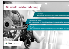
Die private Unfallversicherung