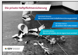
Die private Haftpflichtversicherung